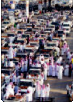
«بريدة»... عاصمة التمور في العالم