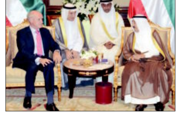
... والسفير الهولندي