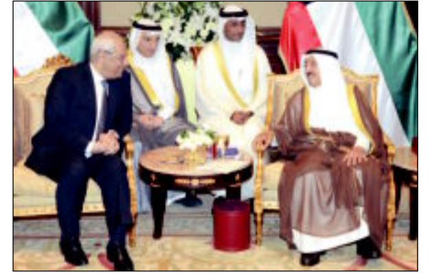
الأمير مستقبلا السفير المصري الجديد