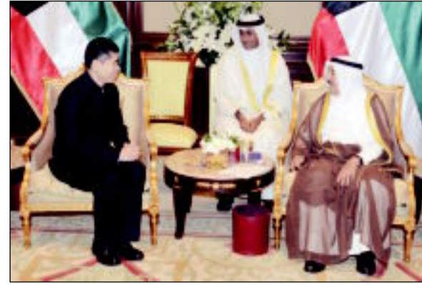
... والسفير الصيني